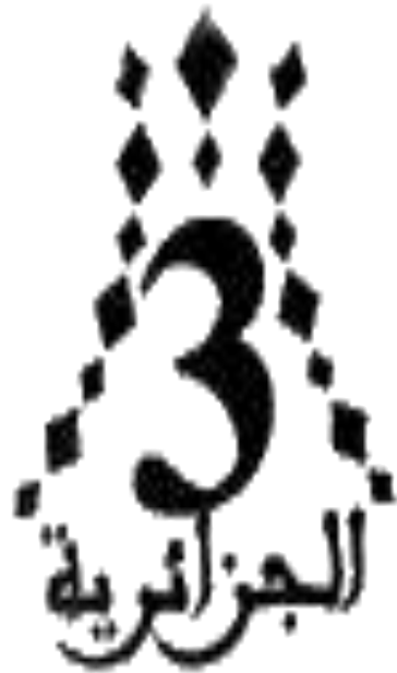
لوغو القناة الثالثة

تأسست قناة المؤسسة، افتتحت رسمياً في 5 يوليو 2001. وهي ناطقة باللغة العربية، تبث بواسطة الأقمار الصناعية وموجهة إلى كافة الوطن العربي. وهي تهدف لربط كل الجالية الجزائرية بالخارج وخاصة في البلدان العربية بموطنهم الأصلي. تعتبر برامج القناة متنوعة بين الأخبار، الأفلام، الرسوم المتحركة وغيرها، وهي مرتبطة بنفس برامج قناة التلفزيون الجزائري الأرضية، بالإضافة إلى برامج أخرى خاصة بالجزائرية الثالثة فقط. في سنة 2007 قامت القناة بتغيير شعارها من رمز الرقم 3 إلى آخر يحمل صورة مقام الشهيد الذي يمثل الرمز التذكاري للحرب الجزائرية، مع الرقم 3. أما في سنة 2015 وبمناسبة الذكرى الثالثة والخمسين لاستعادة السيادة الوطنية على الإذاعة والتلفزيون في الجزائر، بدأت القناة ببث برامجها بجودة عالية الدقة.