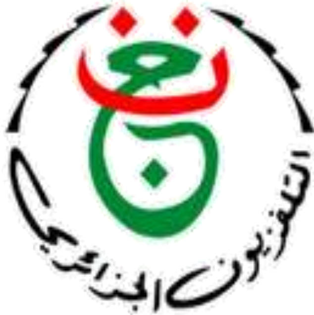
لوغو التلفزيون الجزائري

يضمن التلفزيون الجزائري التغطية عبر كامل التراب الجزائري وهذا من أجل الوصول بأهدافه الاجتماعية والثقافية إلى كل شرائح الجزائر العميقة، إذ تتركز اهتمامات التلفزيون الجزائري كقناة عمومية على البرامج المتنوعة ذات البعد الوطني في الدرجة الأولى، وكذا المجتمع الدولي ومختلف قضاياها الراهنة، التي تحرص المؤسسة على تقديمها إلى الجمهور الجزائري بشفافية كاملة. كما يعمل التلفزيون الجزائري على مواكبة التقنيات الجديدة وتكنولوجيات الإعلام والاتصال، من خلال توسيع حركية الرقمنة داخل المؤسسة والتركيز على العمل بأجهزة متطورة 1 .